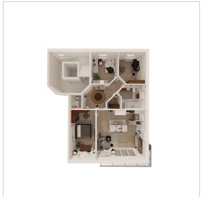
Wohnung Nr. 4

Besichtigungstermine Nach Vereinbarung (auch am Wochenende)